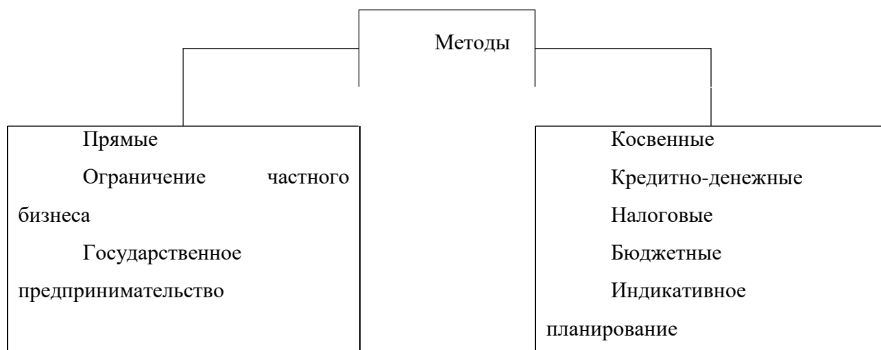
Рисунок 1 - Прямые и косвенные методы государственного регулирования

После названия рисунка следует пропустить одну пустую строку и продолжить текст работы.